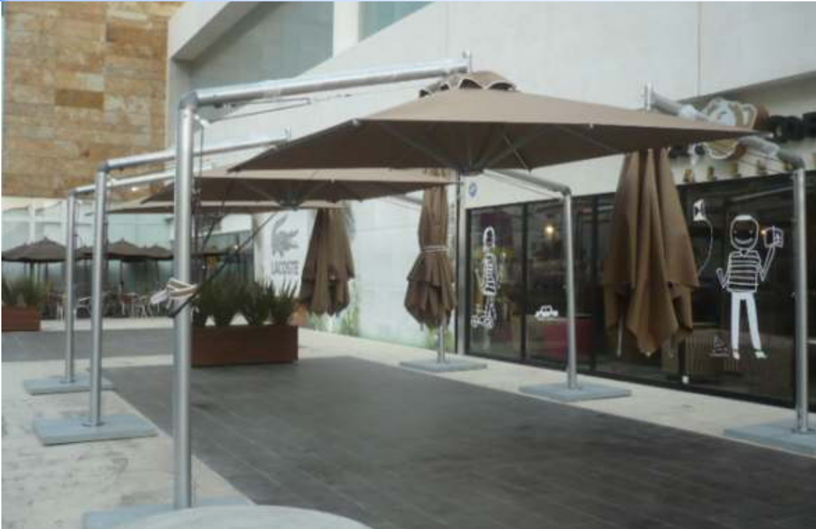
Sombrilla CE de Poste Lateral